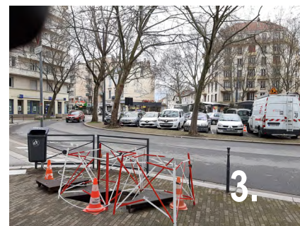
3. Véritable déploiement de la fibre à l'Île Verte ? Un opérateur est en action à de nombreux coins de rue...