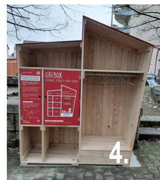
4. La Grebox est arrivée à l'Île Verte, près de la salle polyvalente des Vignes. Un article paraîtra dans la prochaine gazette à ce sujet !