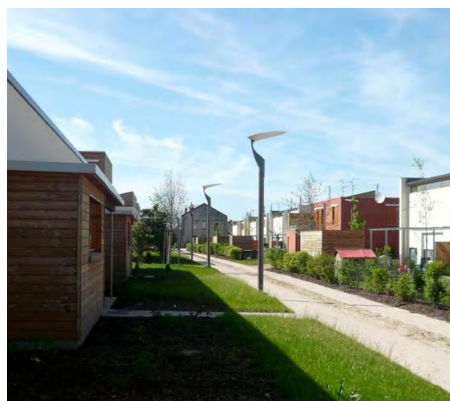
Photo : Exemple de zone de rencontre végétalisée à Montpellier, source Centre d'Études Techniques de l'Équipement Méditerranée.

- sur le court terme : nous sommes à nouveau incités à créer des groupes d'habitants et à proposer des aménagements (végétalisation, jardinières, chicane, peinture)