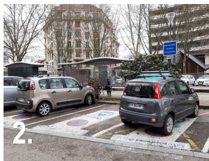
2. Saviez-vous qu'il y a 3 places dédiées à l'autopartage sur la place docteur Girard, dont une avec un siège bébé ? Pour plus de précisions, contactez Citiz.