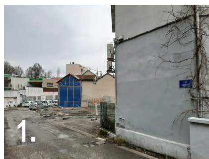
1. La démolition de la rue Farconet est achevée. Reconstruction à suivre.