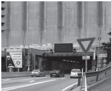
Tunnel de Fourvière