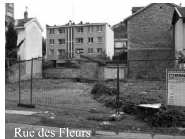
Rue des Fleurs