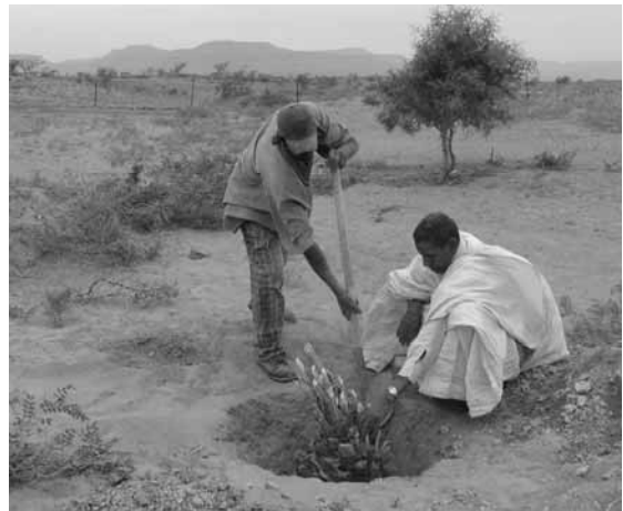
Plantation du premier rejet de palmier sur le site de la Palmeraie Internationale de Wade Seguellil

Aujourd'hui deux familles construisent leurs maisons en bordure de la parcelle. Elles ont un premier élevage de chèvres et s'occupent des jeunes palmiers et quelques autres plantations : figuiers, vignes, néfliers. Petit à petit, elles font des jardins de légumes : carottes, courges, courgettes, plants de kar-kadé et de henné.