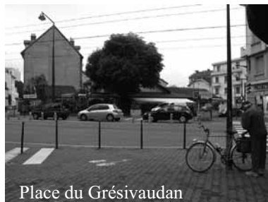
Place du Grésivaudan